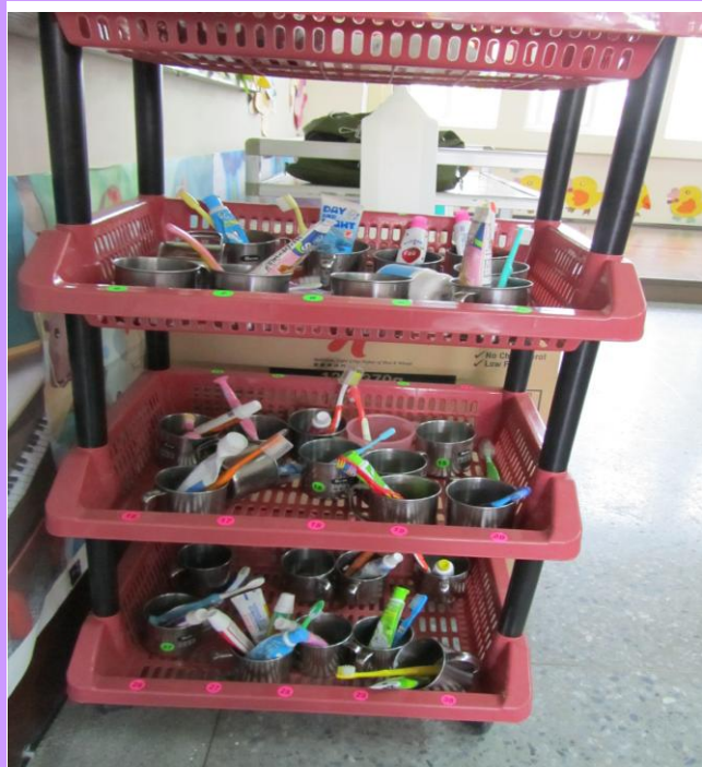
班級牙刷用具擺放整齊